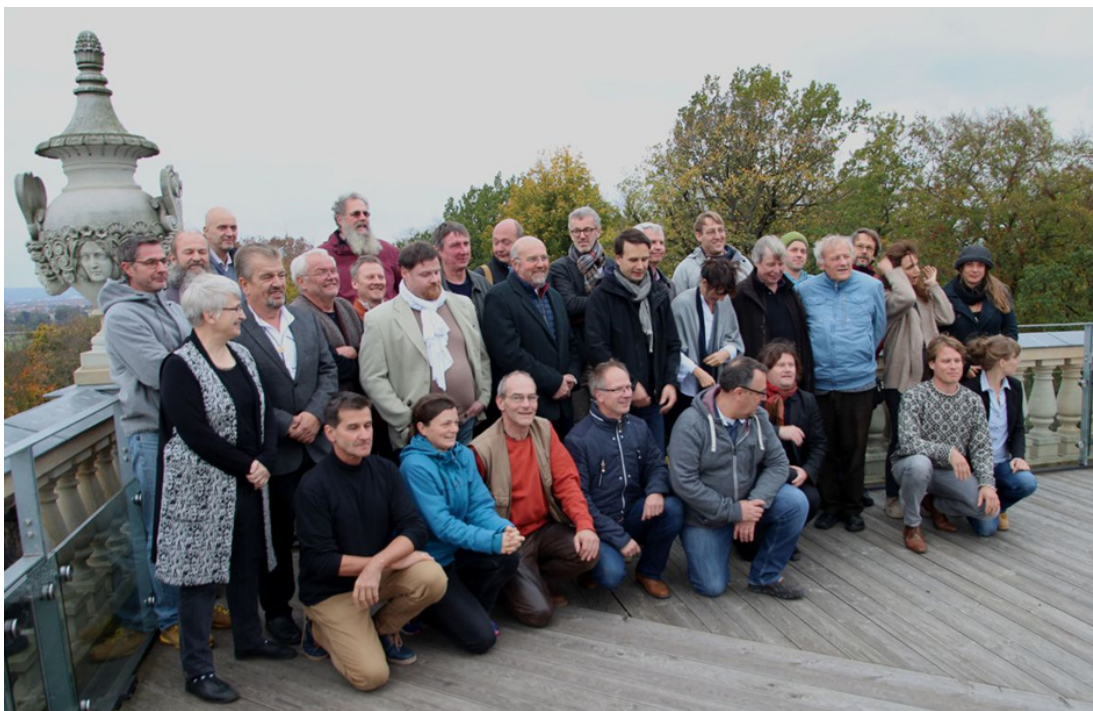
Die Teilnehmer der Mitgliederversammlung auf dem Dach des Lingner Schlosses