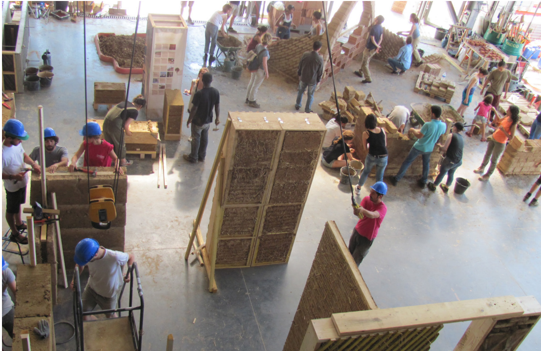
Hochbetrieb in den Les Grands Ateliers beim „Festival Grains d'Isère“ in Frankreich 2017