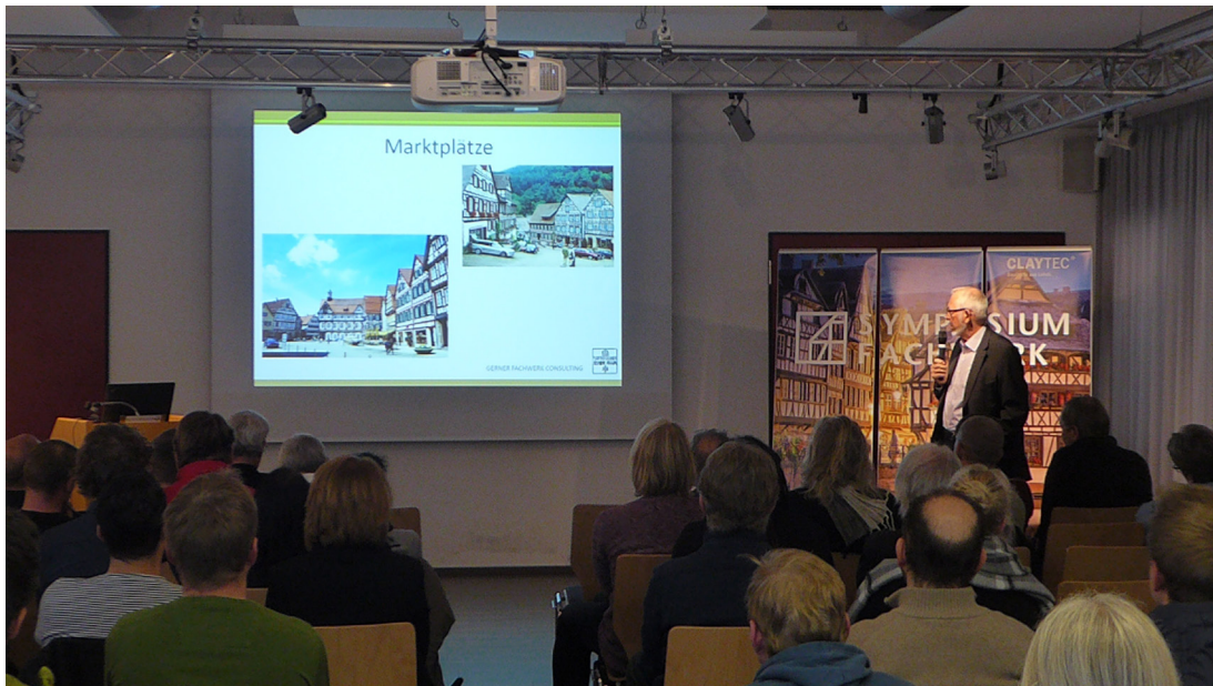
Claytec Symposium Fachwerk 2018